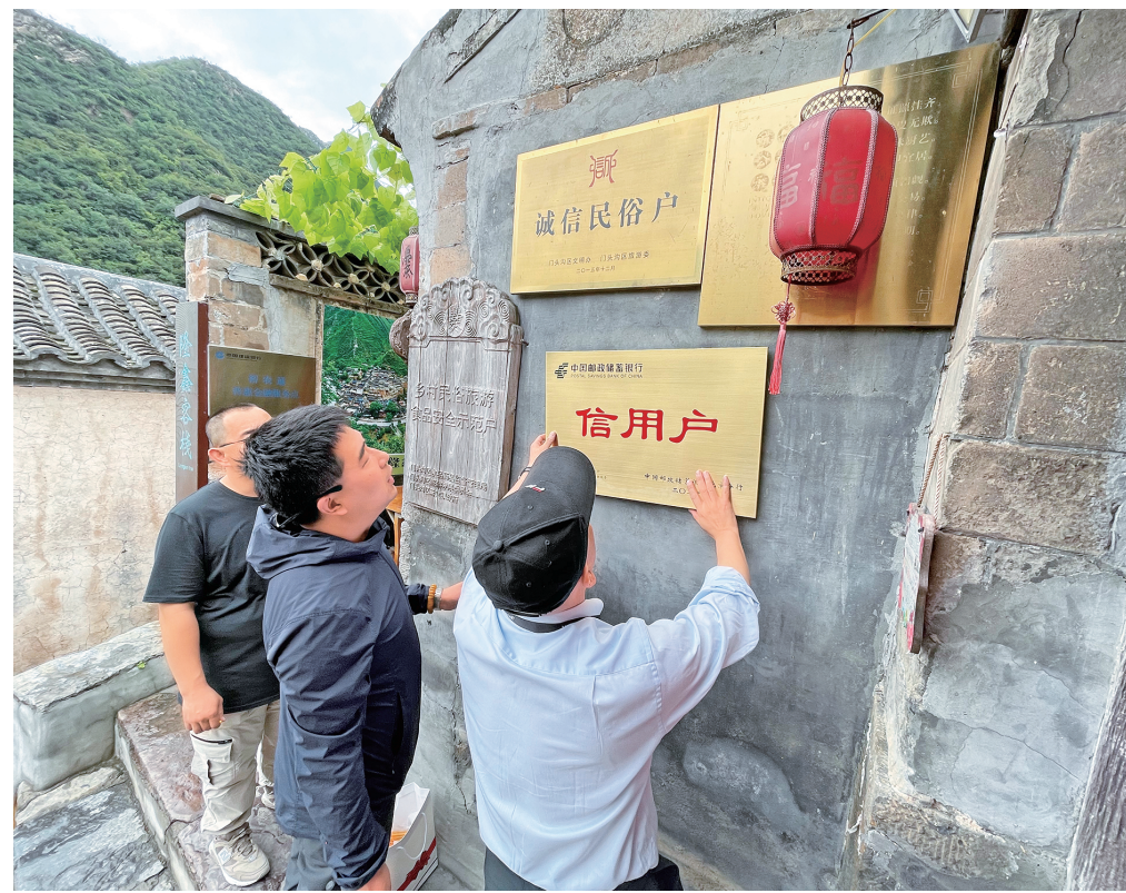
邮储银行北京分行为信用户挂牌。

依托近几年对信用村、信用户的开发取得的成果,北京分行逐个对信用村整个村庄进行综合评估,明确整村授信扫村名单和农村管村客户经理,通过信用村可视化管理平台、H5等线上数字化渠道,将多个农户纳入一个整体,减少了贷款审批时间和程序,提高了贷款效率,可以从整体上支持农村发展,将金融资源更好地用于农村人居环境整治、基础设施建设、基本公共服务能力提升、农村生态保护和绿色发展等方面,帮助提升农村经济发展水平。