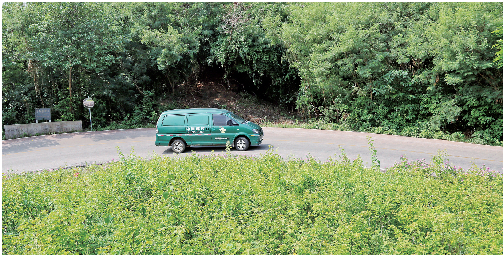
邮车行驶在环岛公路上。

涠洲岛位于广西壮族自治区北海市,是中国最大、地质年龄最年轻的火山岛。岛上植被茂密、风光秀美,素有南海“蓬莱岛”之称。