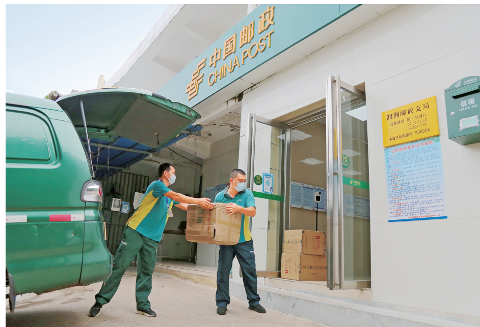
将渡轮运送来的进口邮件接卸下来。